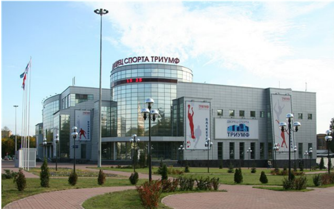
Вид спортивной арены Дворца Спорта "Триумф"