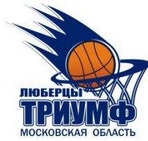
Дворец Спорта "Триумф" Московская область, г. Люберцы, улица Смирновская, дом 4